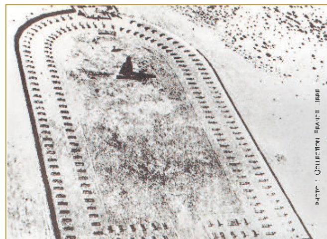
LA NÉCROPOLE DE BIR HAKEIM EN SON ETAT INITIAL