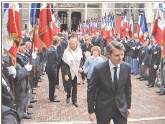
Dans le cortège, monsieur François BAROIN, Maire de Troyes.