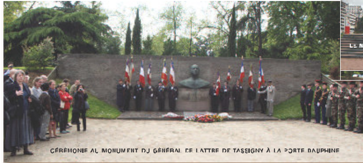
CÉRÉMONIE AU MONUMENT DU GÉNÉRAL DE LATTRE DE TASSIGNY À LA PORTE DAUPHINE

LES CÉRÉMONIES SE SONT DÉROULÉES CONFORMÉMENT AU RITUEL TRADITIONNEL DEVANT LES ANCIENS DE LA 2 e D.B, ET CEUX DE RHIN ET D'ALBES ÉTROITEMENT UNIS ; 15H00 : CÉRÉMONIE DEVANT LA STATUE DU GÉNÉRAL LECLERC DE HAUTECLOCQUE, MARÉCHAL DE FRANCE, À LA PORTE D'ORLÉANS, 17/100 ; CÉRÉMONIE DEVANT LE MONUMENT DU MARÉCHAL DE LATTRE DE TASSIGNY À LA PORTE DAUPHINE, 18H30 : RAVIVAGE DE LA FLAMME SOUS L'ARC DE TRIOMPHE, EN CETTE ANNÉE DU 68 e ANNIVERSAIRE DE LA DISPARITION DU GÉNÉRAL LECLERC DE HAUTECLOCQUE ET DE SES ONZE COMPAGNONS, ELLES CONSTITUAIENT LA PREMIÈRE RENCONTRE NATIONALE DES ANCIENS ET DU SOUVENIR DE L'ÉPOQUE LECLERC.