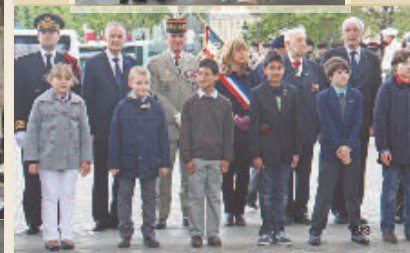
EN PRÉSENCE DES PERSONNAGES CIVILES ET MILITAIRES, AINSI QUE CELLE DES ENFANTS DES ÉCOLES DE SAINT-CLOUD