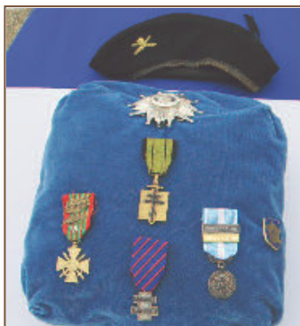
Le resté m'étais saisi d'un long combat au sein de la 2 e D.B. pour la grandeur de la France