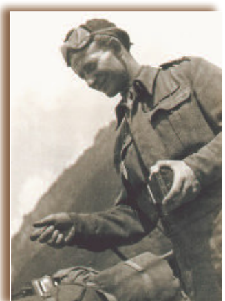
FEMME DE GÉNÉRAL LECLERC DE HAUTELOUQUE LE MINISTRE DE LA DÉFENSE

Robert GALLEY repose désormais en son cher terroir des RICEYS, dans le ciel chrétien communal.