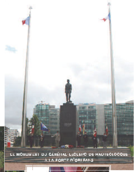
LE MONUMENT DU GÉNÉRAL LECLERC DE HAUTECLOCQUE À LA PORTE D'ORLÉANS