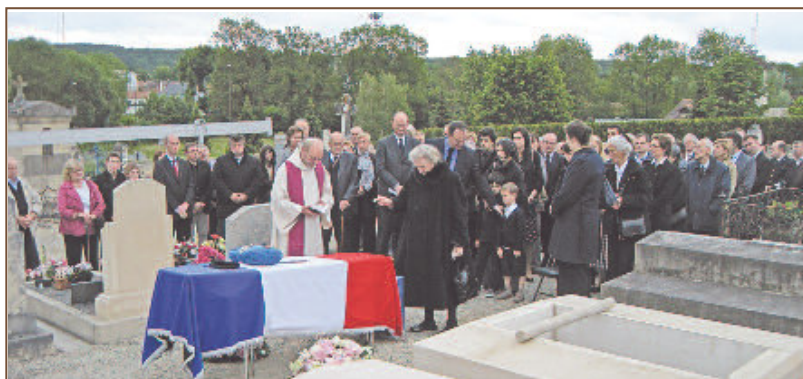
Adieu final des familles GALLEY et LEJLEHC de HAUTECLOCQUE au cimetière des Troyes.